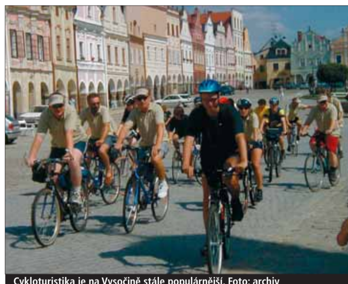
Cykloturistika je na Vysočině stále populárnější.

a expozice Zlaté české ručičky, přivedla do města více turistů. Pelhřimovským muzeem rekordů například prošlo v prázdninových měsících téměř 280 návštěvníků denně. Památky ve Žďáru nad Sázavou, zejména poutní kostel na Zelené Hoře a zámek, jsou v nabídce cestovních kanceláří a letošní návštěvnost je zhruba o 30 procent vyšší, než v předcházejících letech. Infocentrum hlásí zvýšený zájem japonských turistů. Naopak pokles zaznamenal zámek v Telči, mírně i v Náměšti nad Oslavou a v Polně. „Do Třebíče letos přijelo více turistů z Francie, Španělska, Japonska, Skandinávie a také USA,“ pochvaluje si Marie Černá. Návštěvníci Třebíče sem jez-